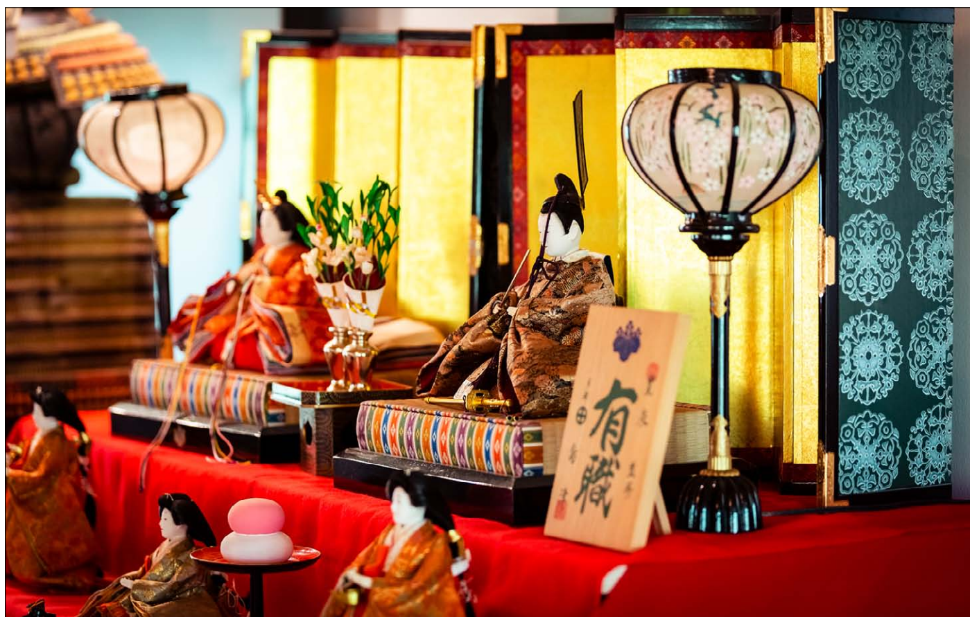
Ausstellung japanischer Kunst