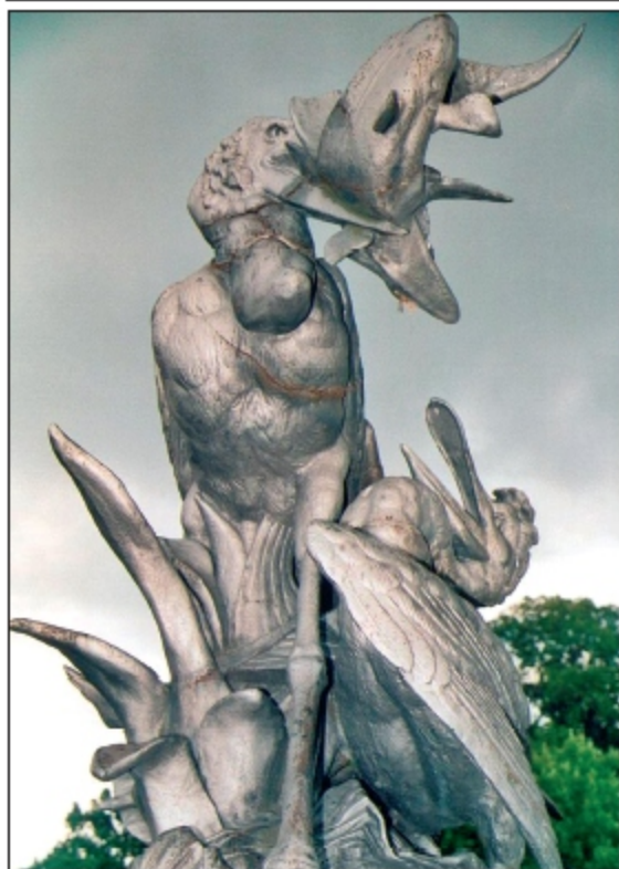
Figurengruppe im Park des ehemaligen Fürstlichen Schlosses der Henckellv. Donnersberg in Neudorf.

ZEITUNG FÜR DIE OBERSCHLESIER IN OST UND WEST