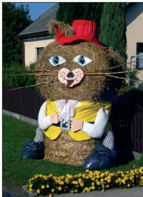
Oberschlesisches Erntedankfest mit dem „gestreiften Kater“