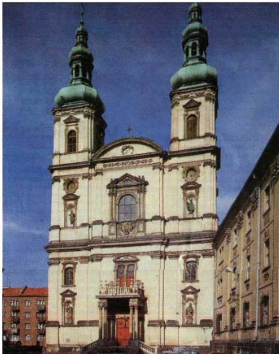
Die Jesuitenkirche in Neisse, entnommen dem soeben erschienenen neuen "Oberschlesischen Bildkalender 2004", zum Preis von 8,60 Euro erhältlich bei der Heimatzeitung „Unser Oberschlesien“ in Görlitz und St. Annaberg (Adresse siehe unten).

WINFRIED GOTTSCHLICH (UO) SIEHE DAZU „FREIES WORT“ S. 2